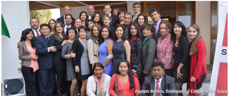
Equipo Bolivia, Embajada y Cooperación Suiza

en Bolivia así como miembros de la comunidad internacional, medios de comunicación y otros sectores importantes del ámbito nacional.