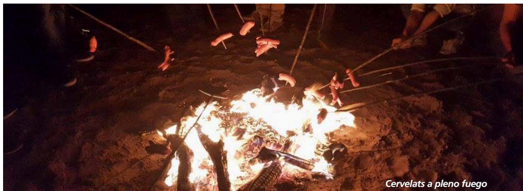
Cervelats a pleno fuego

Si desea participar de la comunidad suizo-boliviana de su ciudad, contacte: La Paz: https://www.facebook.com/com.suizo.boliviana.lapaz/ Cochabamba: https://www.facebook.com/groups/321536098041299/?fref=ts Santa Cruz: https://www.facebook.com/circulosuizo.santacruz?fref=ts