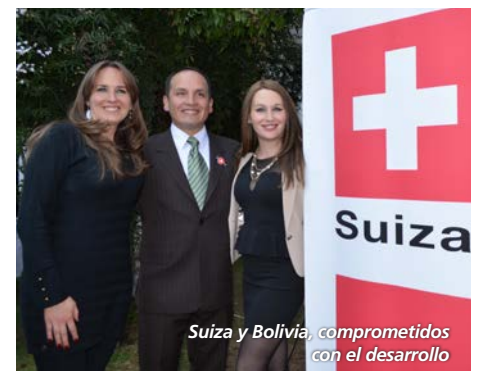
Suiza y Bolivia, comprometidos con el desarrollo

Discurso en: https://youtu.be/4b8d2DdyeNg