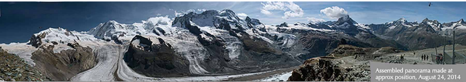
Assembled panorama made at approx position, August 24, 2014

en la región alpina, además se ha previsto el deshielo de muchos glaciares hasta el año 2050. Las áreas de esquí que, mediante nieve artificial y un turismo veraniego ampliado, resisten al cambio climático registrarán importantes pérdidas económicas en un futuro próximo. Aunque Suiza contribuye con el 0,1 % a las emisiones de gases de efecto invernadero mundiales, y por su tamaño tiene poca influencia en el desarrollo del clima del planeta; sufrirá también en gran medida las repercusiones del cambio climático. Por lo tanto, a Suiza como país le interesa dar buen ejemplo en este ámbito y comprometerse especialmente con la protección del clima del planeta con base en su capacidad innovadora, y sobre todo en la demostración ante el mundo de que los objetivos económicos se pueden conjugar con la protección del clima.