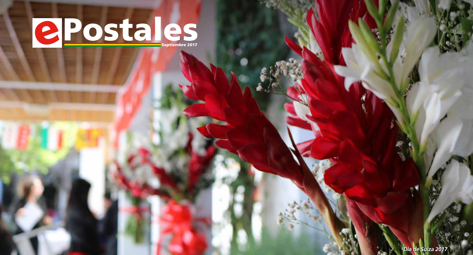
Día de Suiza 2017