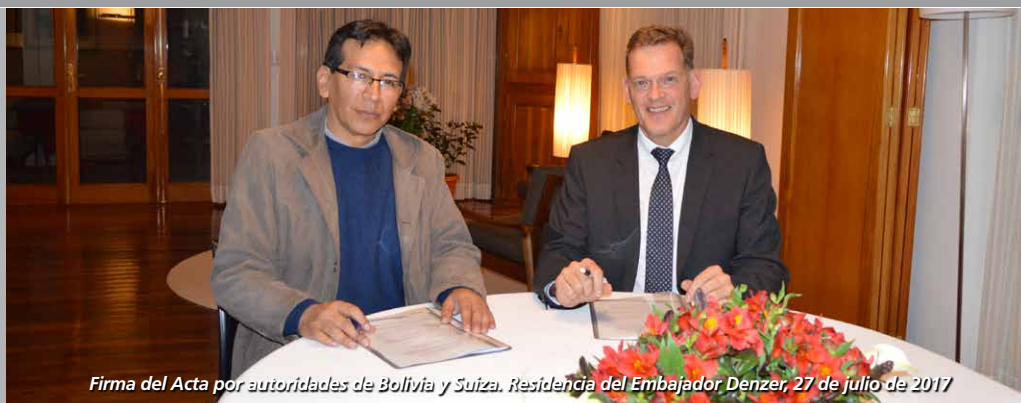
Firma del Acta por autoridades de Bolivia y Suiza. Residencia del Embajador Denzer, 27 de julio de 2017

La nueva Estrategia de Cooperación de Suiza con Bolivia por los siguientes 4 años, continuará apoyando a Bolivia en tres ámbitos temáticos: Gobernabilidad, Desarrollo Económico y Cambio Climático y Medio Ambiente; así como Gobernabilidad y Género como temas transversales