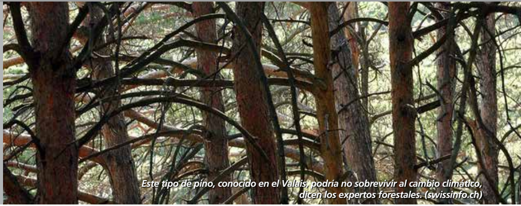
Este tipo de pino, conocido en el Valais, podría no sobrevivir al cambio climático, dicen los expertos forestales. (swissinfo.ch)

Es un hecho que mientras las temperaturas globales han aumentado en 0.85 grados Celsius en promedio desde el comienzo de la industrialización, Suiza se ha calentado en 1.8 grados