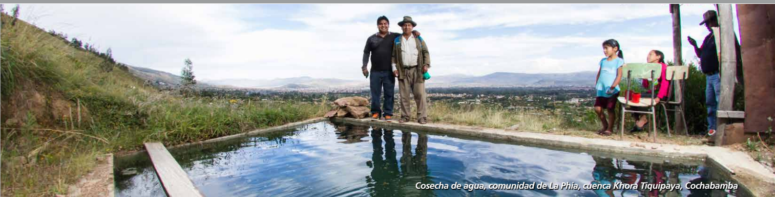
Cosecha de agua, comunidad de La Phía, cuenca Khorá Tiquipaya, Cochabamba