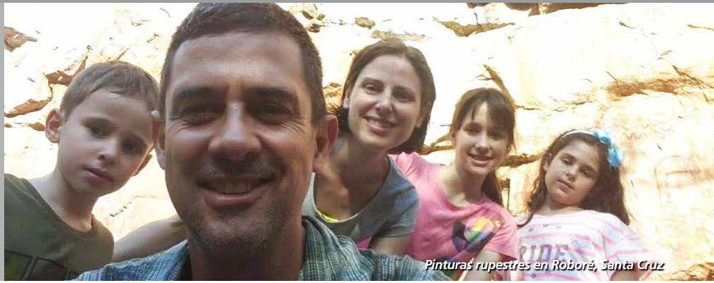
Pinturas rupestres en Roboré, Santa Cruz