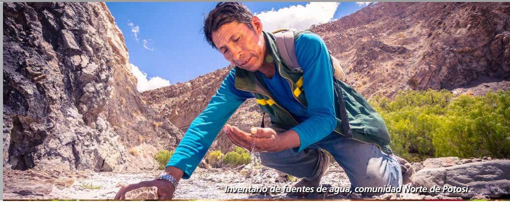
Inventario de fuentes de agua, comunidad Norte de Potosí