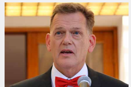
Roger Denzer Embajador de Suiza en Bolivia

Los retos mundiales son grandes y dispersos: el endeudamiento, la migración, la inclusión, el reconocimiento del otro como semejante, la valorización del diferente como elemento de crecimiento y muchos otros. Hay tanto por hacer; sin embargo, rescato el enfoque en los jóvenes del mundo y no tengo dudas que la comunidad internacional – rescatando la esencia de los objetivos del desarrollo sostenible hacia la Agenda 2030 – encontrará caminos alternativos y conjuntos para mejorar la situación global. Quizá tome tiempo, quizá logre desencantarnos a veces y acrecentarnos las dudas, pero con creatividad, con un espíritu democrático e inclusivo, fortaleciendo los valores de la humanidad y dedicándose siempre a la búsqueda de la verdad por medio de las evidencias, seguiremos adelante y lograremos avanzar.