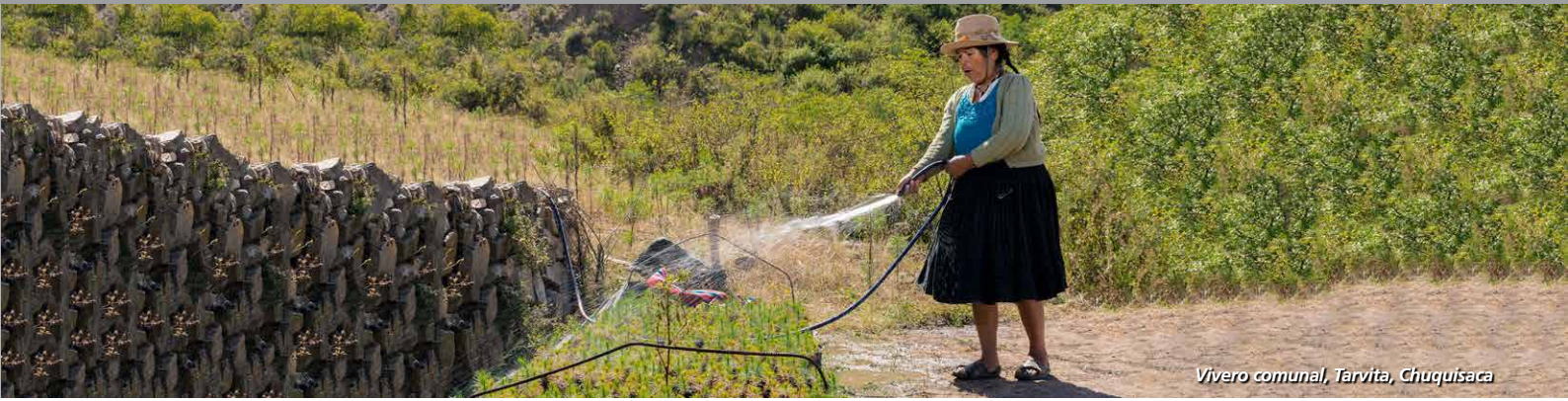
Vivero comunal, Tarvita, Chuquisaca