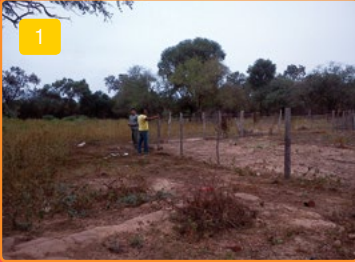
1. Ubicación de la parcela